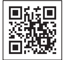
ကိုရိုနာဗိုင်းရပ်စ် ကာကွယ်ဆေး လမ်းညွှန် နှစ်ဖက်မြင်ဘားကုတ်ဒ်

ကိုရိုနာဗိုင်းရပ်စ်ကာကွယ်ဆေး လမ်းညွှန်ဝက်ဘ်ဆိုက်လိပ်စာ: https://v-sys.mhlw.go.jp